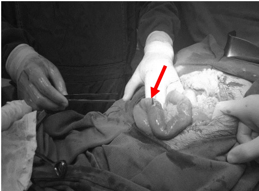
Figura 1: Fragmento de madeira transfixando o jejuno proximal.