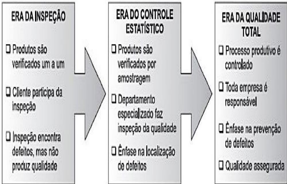
Figura 1: Eras da gestão da qualidade.