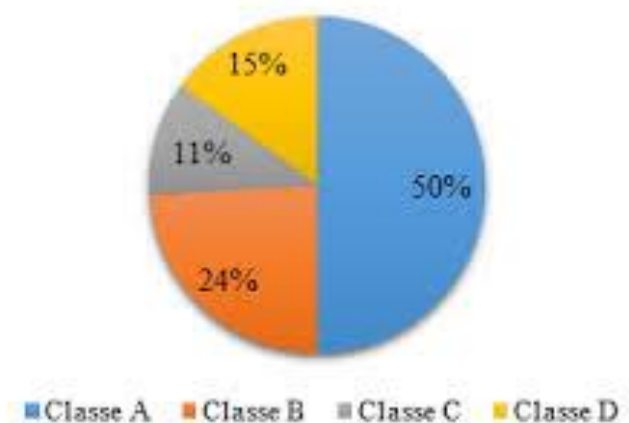
GRÁFICO 2 – Resíduos por classe - Manaus

No gráfico a seguir temos o estudo feito na cidade de Manaus mostrando quantidade em porcentagem por classe de cada tipo resíduos das empresas em Manaus: