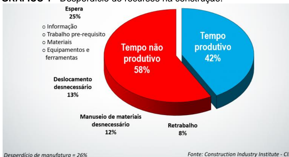
GRÁFICO 1 - Desperdício de recursos na construção.

No Gráfico a seguir temos a demonstração por porcentagem do desperdício de tempo em etapas da construção civil: