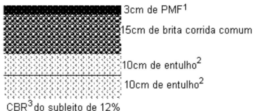
FIGURA 2 – Esquema de pavimento