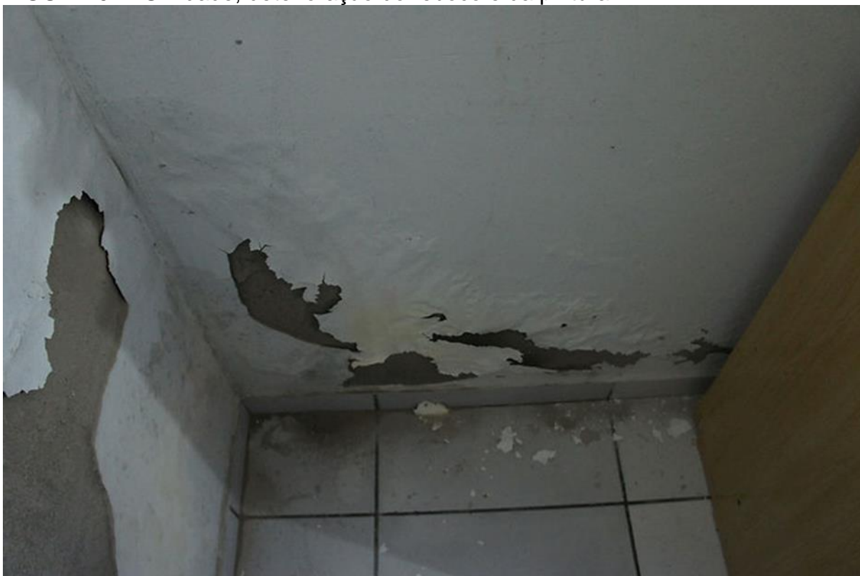
FIGURA 04 - Umidade, deterioração do reboco e da pintura

Possui ótima cobertura e alastramento. Devido a sua intensidade de brilho, proporciona alta impermeabilidade quando aplicada em ambientes externos e em superfícies internas oferece grande facilidade de limpeza. Possui alta durabilidade, resistência, cobertura e rendimento. Esmalte Sintético é indicado para aplicação em superfícies de metal e madeira, de fácil aplicação e alta resistência às intempéries. Possui ótima secagem, além de proporcionar excelente acabamento. Vernizes é indicado para tratamento, proteção e embelezamento da madeira, que por ser um material nobre e 100% natural, precisa de cuidados especiais que realcem e mantenham sua beleza. Texturas possibilita diversos tipos de acabamento, podendo ser aplicado com rolos de efeitos especiais, escovas, esponjas, etc. É um produto de uso bastante flexível, podendo dar, sob aplicação de verniz, um efeito de envelhecido (SANTOS, 2010).