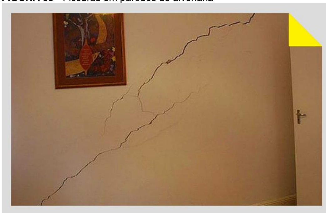
FIGURA 05 - Fissuras em paredes de alvenaria

As fissuras que ocorrem devido à compressão, podem ser evitadas por um dimensionamento que considera a ação de todos os esforços atuantes na peça e, por sua vez, o uso seja compatível com o carregamento previsto em projeto. Entretanto, se o problema já estiver implantado, pode-se recorrer ao reforço do elemento estrutural de diversas maneiras como utilizar-se a colagem de chapas de aço, ou a colocação de armadura para servir como suplemento e posterior enchimento com graute ou microconcreto.