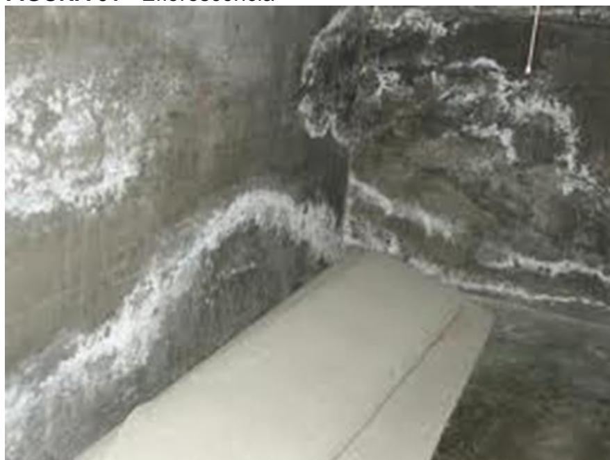
FIGURA 01 - Eflorescência