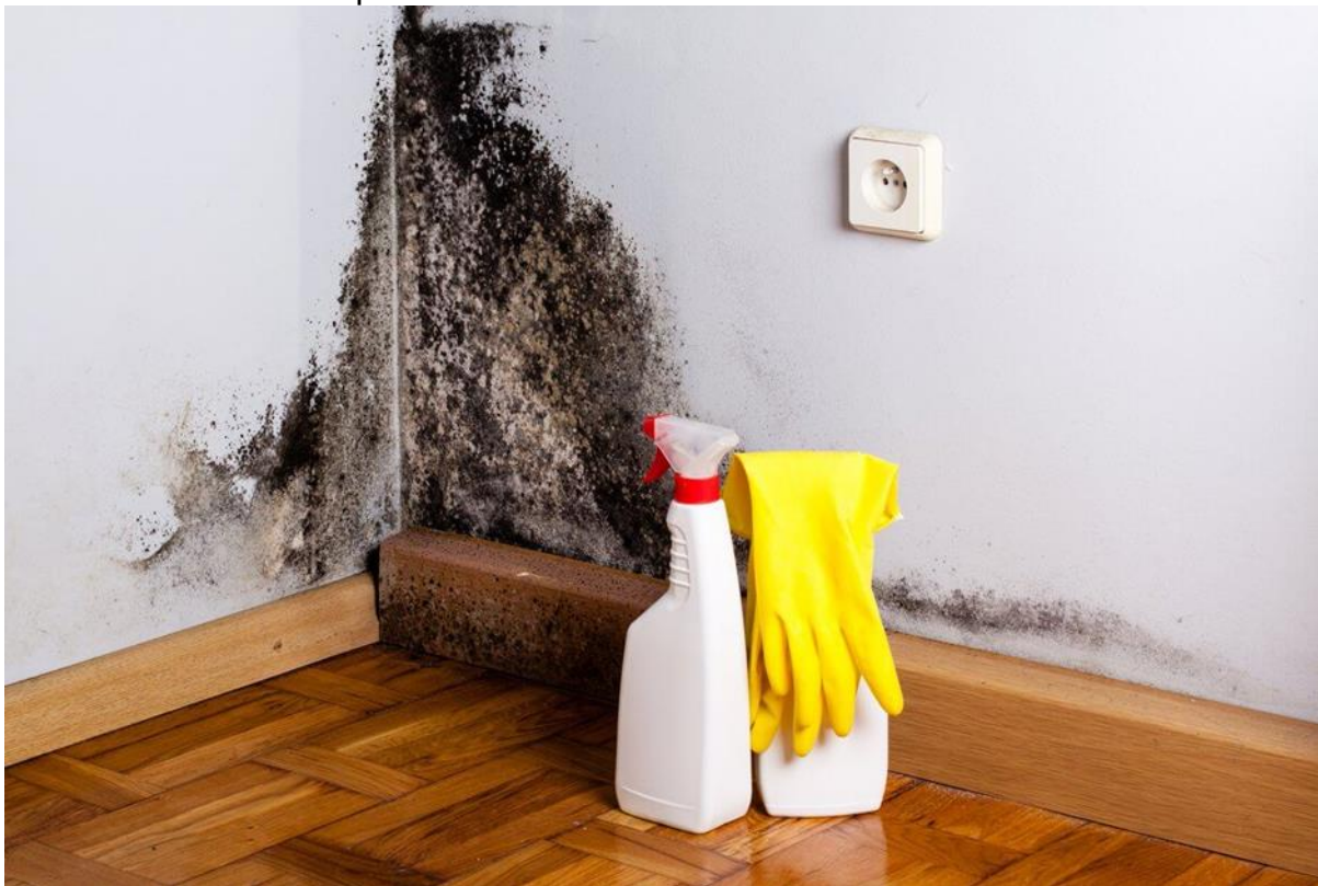
FIGURA 03 - Mofo em paredes

nas paredes onde passa tubulação de ar condicionado, fazer utilização de pintura antimoho quando houver pintura na edificação.