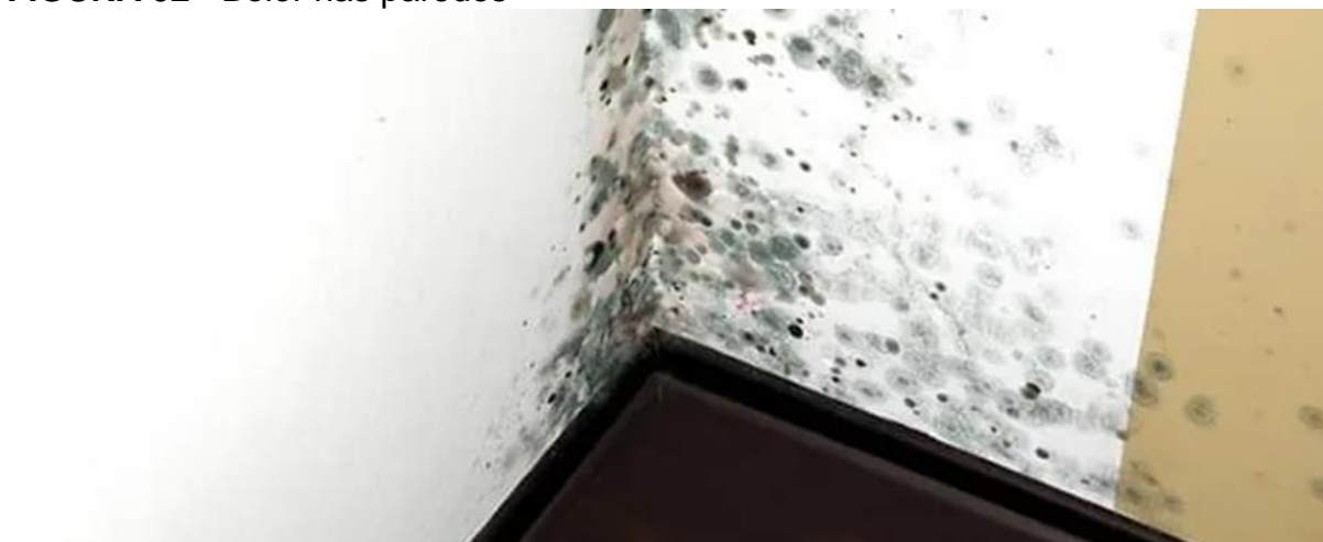
FIGURA 02 - Bolor nas paredes

A Figura 02, apresentada a seguir, apresenta os bolores nas paredes.