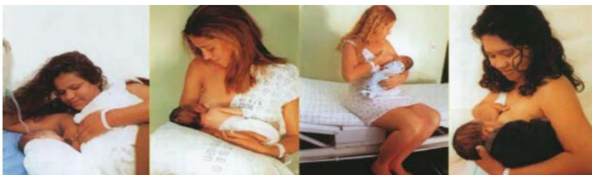
IMAGEM 2 – Postura mãe e bebê

Para saber se a pega está correta devemos estar atentos a alguns pontos. Observar se a aréola está mais visível na parte de cima, a boca do bebê deve estar bem aberta com o lábio inferior voltado para fora, queixo tocando a mama. Há alguns sinais que mostram que a técnica está incorreta, como por exemplo, bochechas do RN com covinhas na hora da sucção, ruídos, mama esticada ou deformada durante a mamada, dor na amamentação. Quando a mama estiver muito cheia irá dificultar na pega, recomenda-se retirar manualmente um pouco de leite (DEMITTO, M.O. et al., 2010).