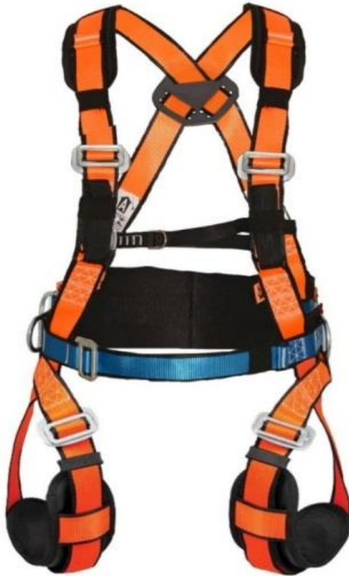
FIGURA 8: Cinto de Segurança Tipo Paraquedista