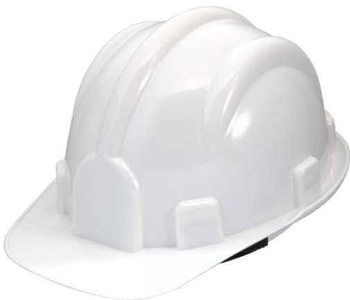
FIGURA 4: Capacete de Segurança