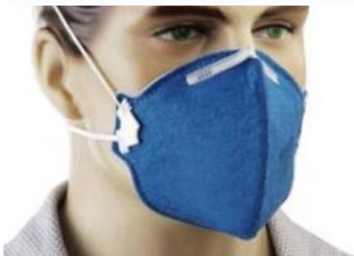
FIGURA 6: Mascara de Segurança