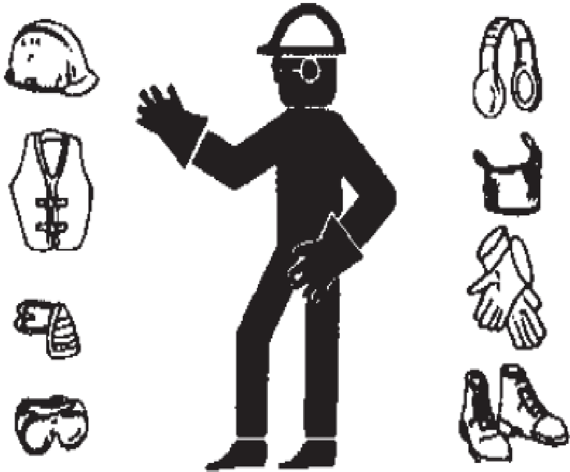
FIGURA 1: Equipamentos de Proteção Individual