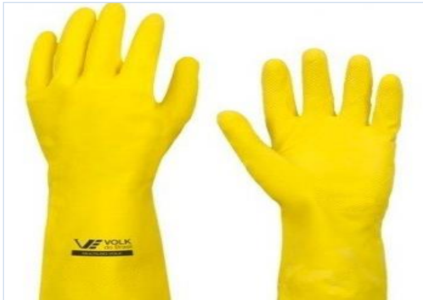
FIGURA 10: Luva de Latex