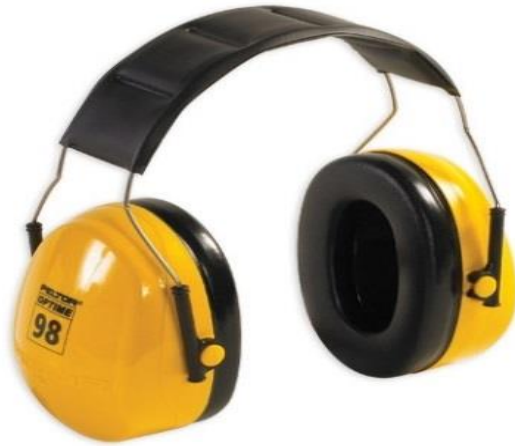
FIGURA 3: Protetor Auditivo Tipo Concha