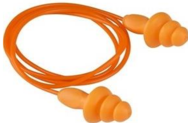
FIGURA 2: Protetor Auditivo Tipo Plug