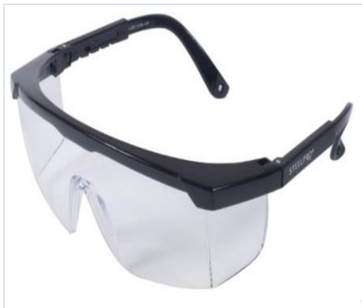
FIGURA 11: Óculos de Proteção