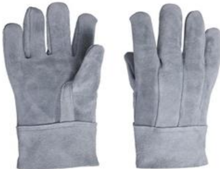
FIGURA 9: Luva de Raspa