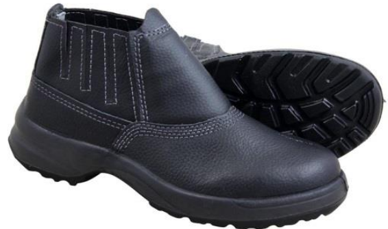
FIGURA 5: Botina de Segurança