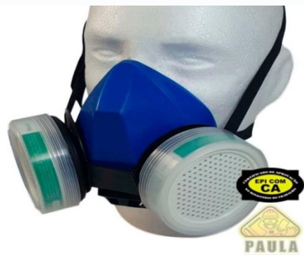
FIGURA 7: Mascara Produtos Químicos