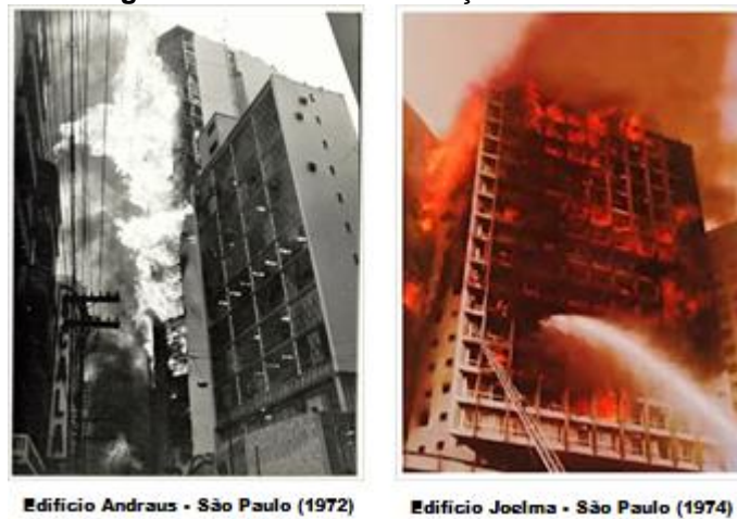
Figura 4 - Edifícios em situação de incêndio.

O concreto armado no momento em que é exposto a um incêndio está sujeito a elevadas temperaturas e a um calor considerável. Ao combater o incêndio com água ocasiona um choque térmico acarretando o surgimento de fissuras (BAUER, 2008).