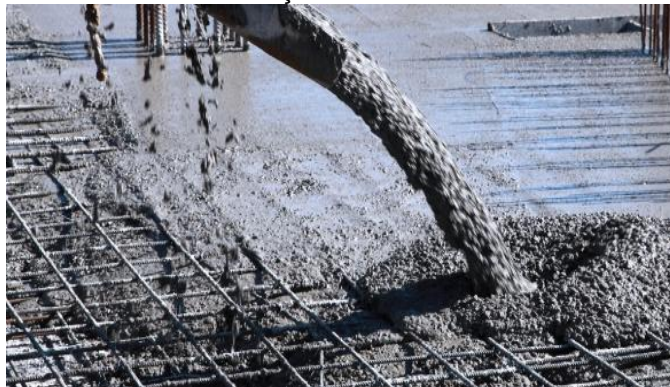
Figura 1 – Armaduras de aço recebendo o concreto ainda fluido.