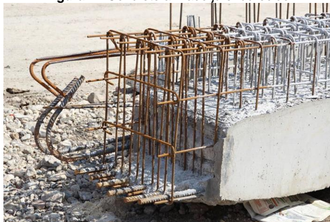
Figura 2 - Concreto armado já endurecido.

Nos dias de hoje é o material mais utilizado na construção de estruturas de edificações e grandes obras viárias como viadutos, passarelas, pontes, e etc. Sua utilidade é conhecida em todo o mundo, visto que a estrutura de concreto armado em meios não agressivos, resiste mais de cem anos e sem manutenção (BOTELHO, 2006).