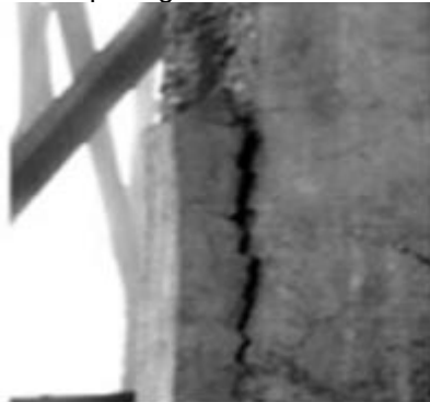
Figura 5 – Spalling em estrutura de concreto.

Dentre as formas de degradação das estruturas de concreto, ressalta-se o fenômeno do lascamento, também conhecido como spalling que pode apresentar um caráter imprevisível, durante os primeiros minutos do incêndio conforme a figura 5. O lascamento é um fenômeno originado nas estruturas de concreto, no momento em que elas são expostas à altas temperaturas, uma vez que dentro da matriz do concreto manifestam-se tensões de origem térmica, que apresentam-se em forma de desintegração das regiões superficiais. Em determinados casos o lascamento pode ser provindo das naturezas mineralógicas do agregado e de elevadas tensões de compressão na seção transversal de concreto ao decorrer do sinistro (COSTA et al. , 2002).