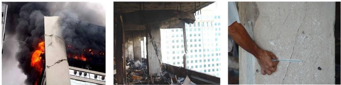
Figura 3 - Pilares e vigas em concreto armado comprometido após incêndio.