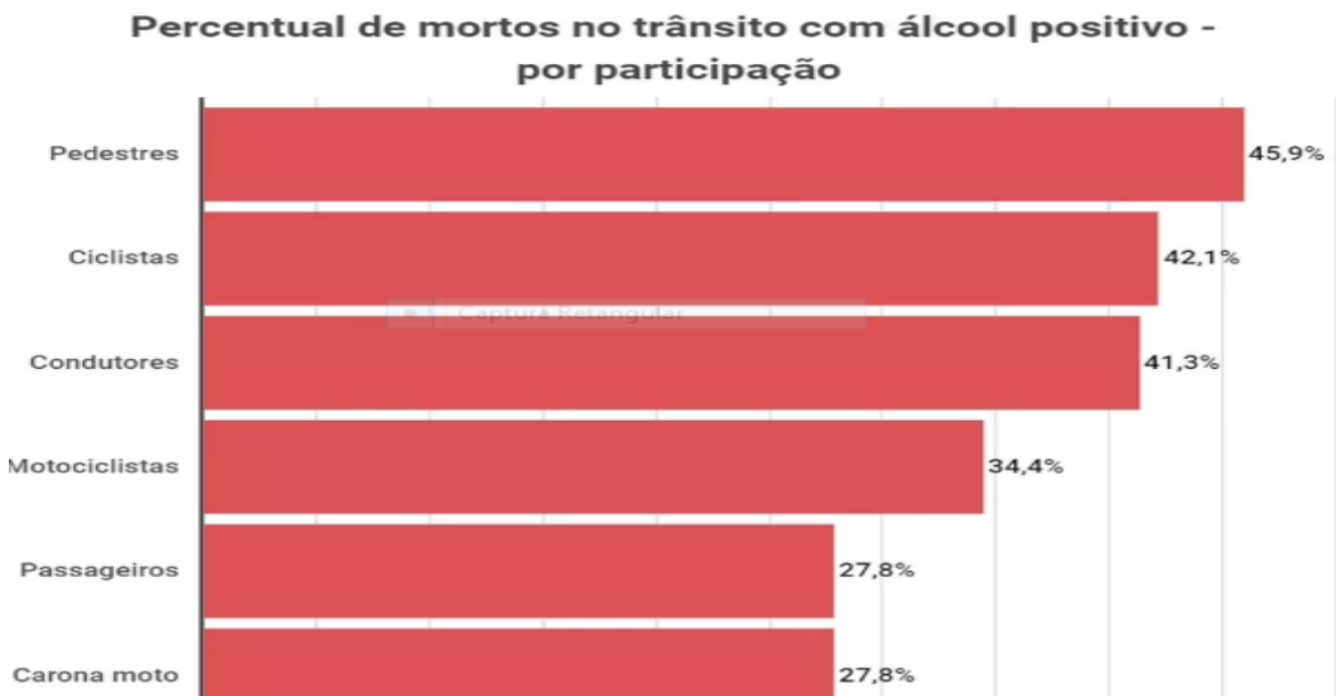
FIGURA 1 – Gráfico do número de mortes no estado do Rio Grande do Sul, no ano de 2018, por categorias.

Em território nacional, estende Rios (2019), pesquisa realizada no Rio Grande do Sul sobre mortes causadas por acidentes de trânsito apontaram que em 38,3% das vítimas foi constatada presença de álcool no sangue. Este estudo foi feito pelo cruzamento de informações do Detran do mesmo estado e relatórios de perícias do Instituto-Geral de Perícias com dados relativos ao ano de 2018. Na amostra analisada foram captadas informações de 1.047 vítimas, representando, para o estado do Rio Grande do Sul, 62,7% do total de mortos neste período. No mesmo estudo foi constatado que entre os motoristas mortos por acidentes de trânsito no ano analisado, 41,3% apresentaram considerável grau alcoólico no sangue. Em análise mais detalhada, foi apurado que 94,7% das mortes onde se constatou presença de álcool no sangue, ocorreram nos finais de semana, entre sexta-feira e domingo e, mais detalhadamente foram apurados os seguintes dados: