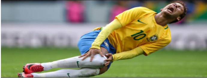
FIGURA 4 – Neymar expressando dor no joelho.