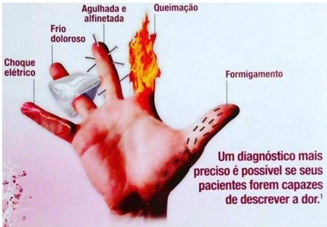
FIGURA 2 – Sensações da dor neuropática.

Como consequência aparecem sensações típicas como agulhadas, queimação, formigamento, choques, frio e hipersensibilidade ao toque, que variam de indivíduo para indivíduo. É importante sabermos que a dor neuropática aparece como sintoma e depois se torna a doença em si.