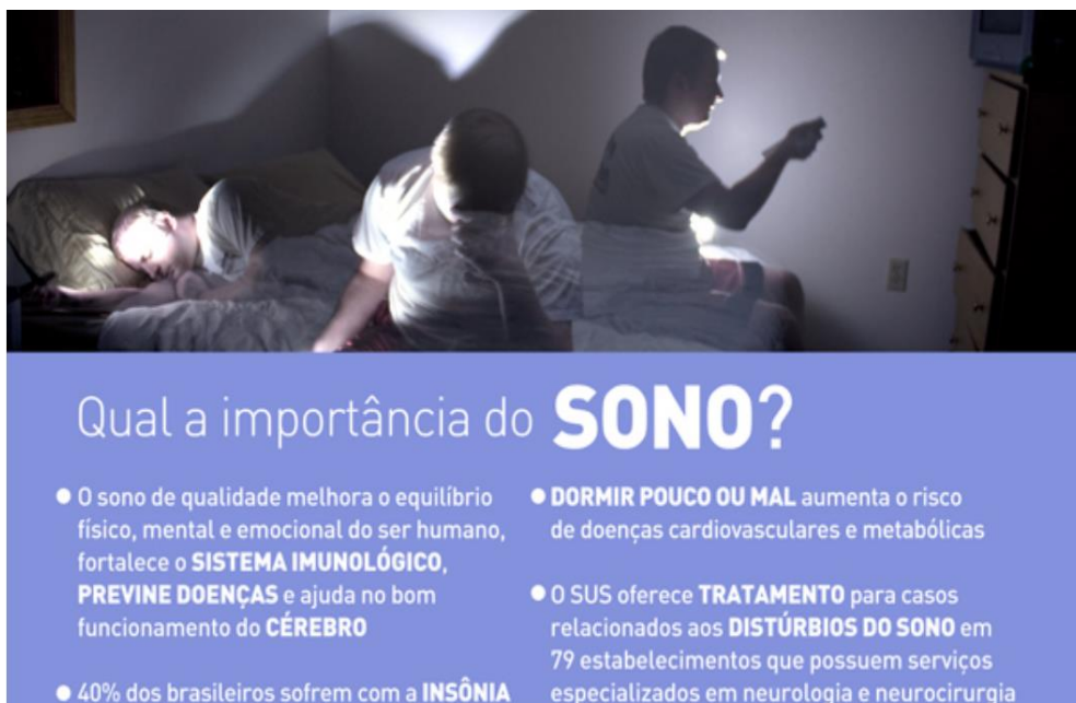
FIGURA 3 – O sono e a qualidade de vida.

Uma noite de sono ruim têm capacidade de retardar os processos cognitivos, alterar o humor, enfraquecer o sistema imunológico, aumentar o estresse e conseqüentemente aumentar a percepção dolorosa.