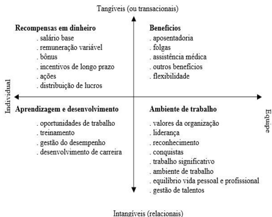
Figura2 – Modelo geral de recompensas (Fonte: Armstrong (2007, p.34))

Armstrong (2007) tem duas visões a respeito das recompensas, sendo elas: Visão individual ou equipe, conforme mostra a figura 2. As recompensas em equipe são importantes para construir o trabalho em equipe.