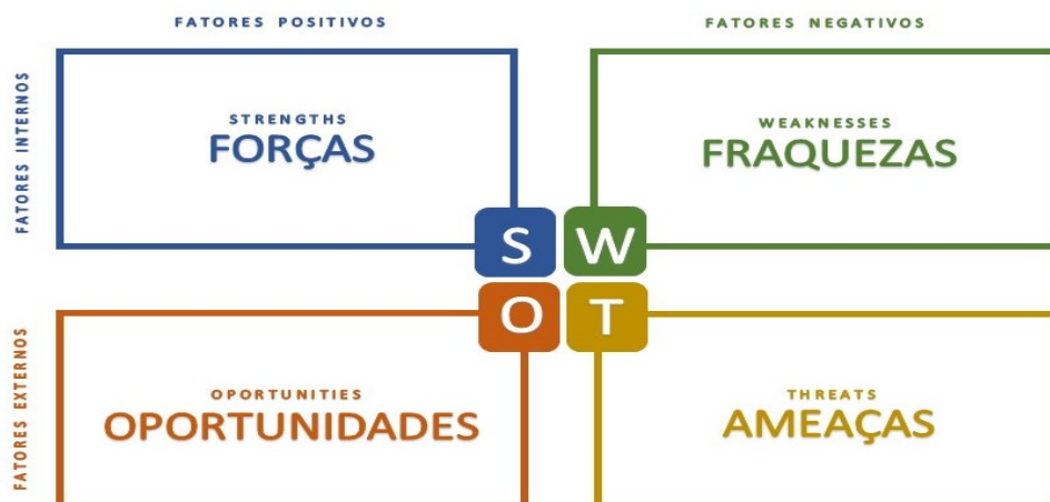
Figura 2 - Matriz SWOT