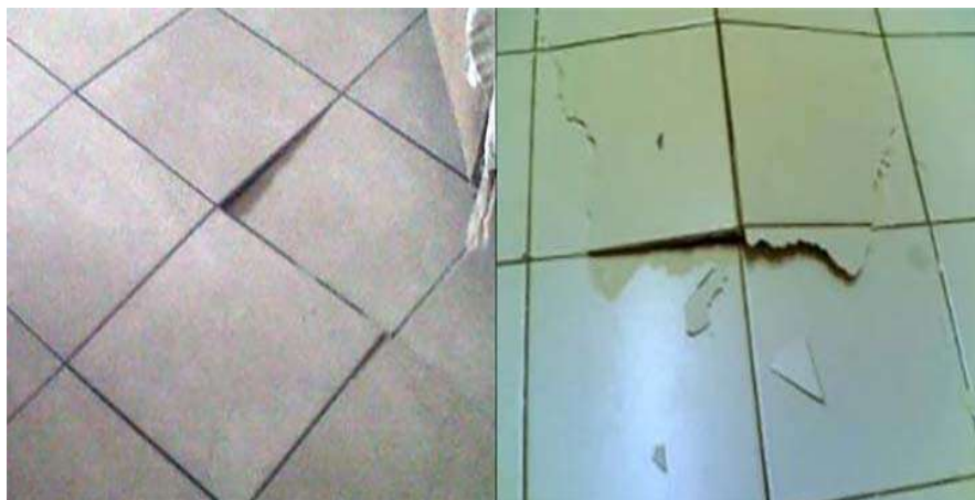
Figura 2 - Exemplo de destacamento de revestimento cerâmico.